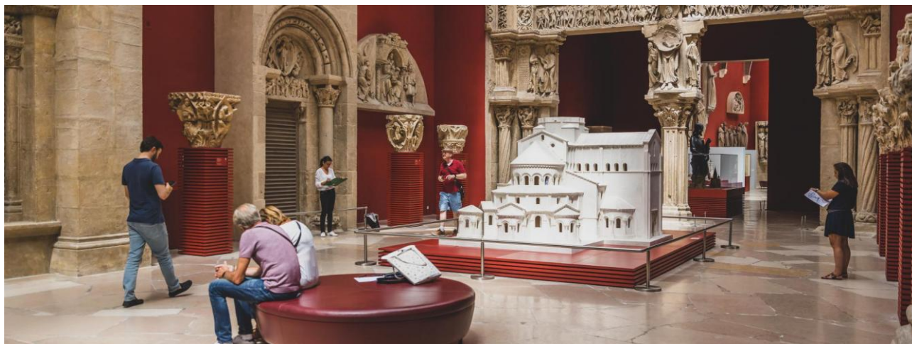
Galerie des moulages.

Première galerie traversée par les visiteurs, la galerie des moulages impressionne par la taille des moulages qui la compose et la variété des décors. La hauteur sous plafond de près de 14 mètres et sa verrière d'époque marque les esprits.